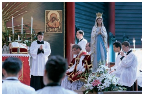
Eröffnungshochamt in der Herz-Jesu und Mariä-Sühnekirche in Wigratzbad