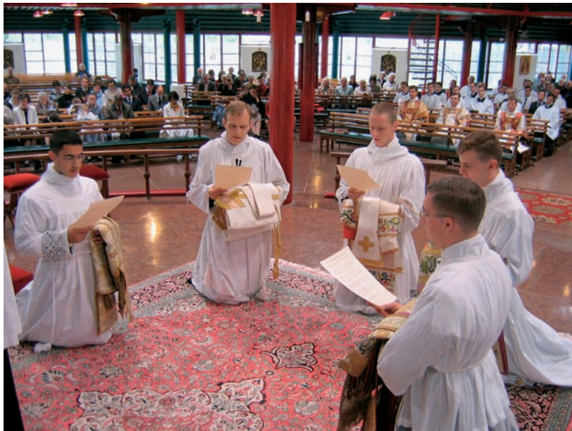
Das Versprechen vor der Diakonatsweihe

aus der heiligen Weihe erwachsen, und sie mit Gottes Hilfe sein ganzes Leben lang tragen zu wollen. Insbesondere sei er sich (3.) klar bewusst, was der Zölibat von ihm verlange. Mit Gottes Hilfe wolle er ihn gerne und vollständig bis ans Ende bewahren. Schließlich gelobt er (4.) in reiner Treue den kirchlichen Gehorsam zu beobachten und bereit zu sein, in Wort und Tat ein gutes Beispiel zu geben: „So verspreche ich, so gelobe ich, so schwöre ich, so wahr mir Gott helfe und dieses heilige Evangelium, welches ich mit meinen Händen berühre.“