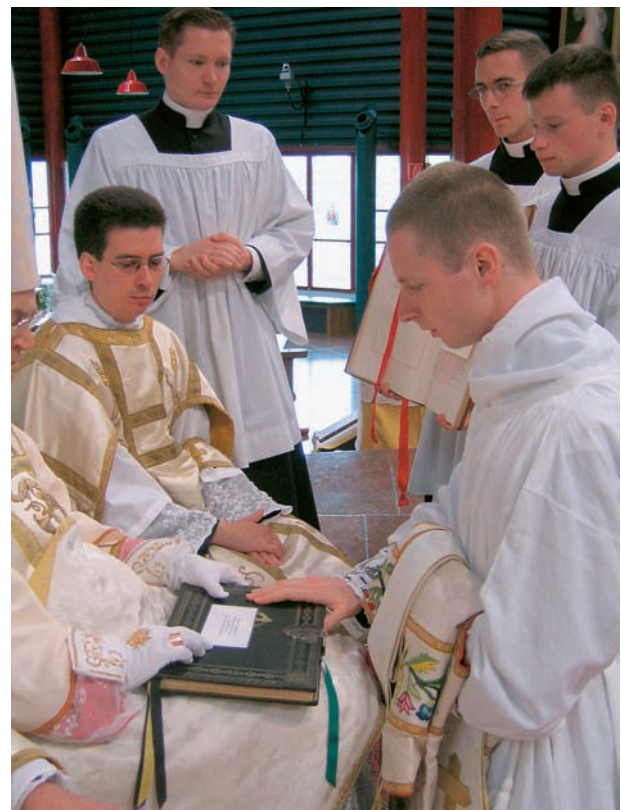
Der Eid auf das Evangelium

und sich freier dem Dienst für Gott und für die Menschen widmen“ (Direktorium 58). Für den priesterlichen Dienst ist es von großem Vorteil, durch keine Gatten- oder Vaterpflichten gebunden zu sein und frei von irdischen Sorgen über die Zeit verfügen zu können. (6.) Schließlich ist der Zölibat auch Zeichen einer eschatologischen Realität [vgl. Direktorium 58], denn „bei der Auferstehung wird weder geheiratet noch verheiratet, sondern sie sind wie die Engel Gottes im Himmel“ (Mt 22,30).