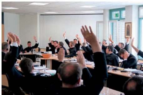
Abstimmung per Handzeichen