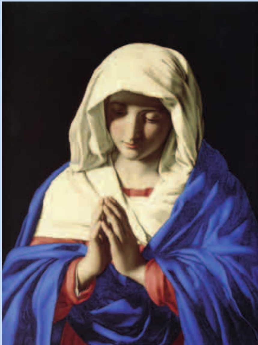
Maria im Gebet, Sassoferrato um 1650, National Gallery London