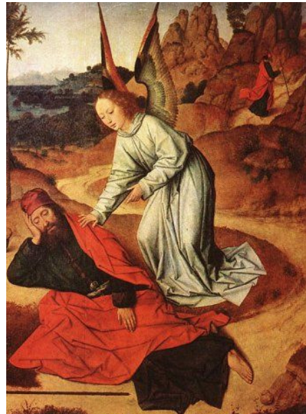
Bild: Der Prophet Elija

Wer ist der Lügner – wenn nicht der, der leugnet, daß Jesus der Christus ist? Das ist der Antichrist: wer den Vater und den Sohn leugnet“ (1Joh 2,18–22).