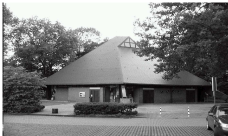
Kirche St. Joseph Recklinghausen-Grullbad