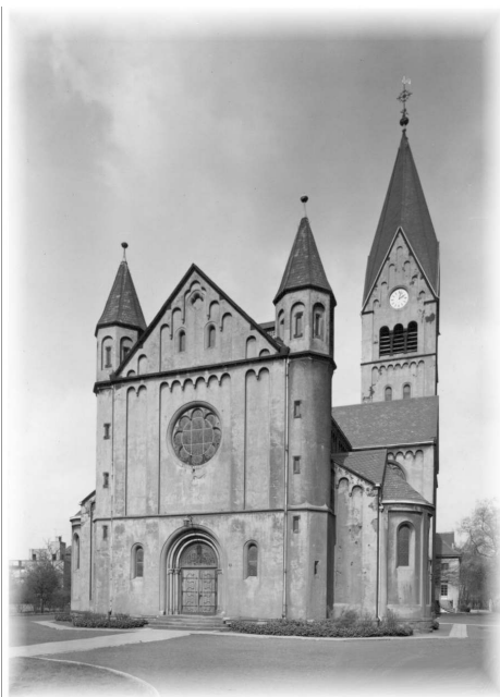
Kirche St. Michael Recklinghausen-Hochlarmark